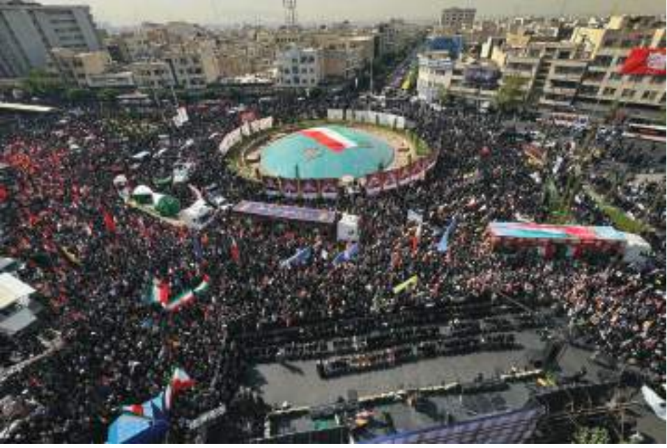
கமேனிக்கு அஞ்சலி செலுத்த கூடிய மக்கள் கூட்டம்

வருகின்றன. ஈரான் நாற்றுக்கணக்கானபாலிஸ்டிக் ஏவுகணைகளை செலுத்தி பதிலடி தருவதால் போர்ப் பதற்றம் உச்சத்தை தொட்டுள்ளது.