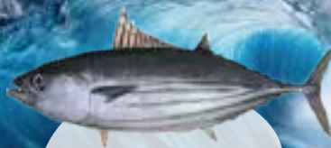
வரிச் சூரை (Skipjack Tuna)