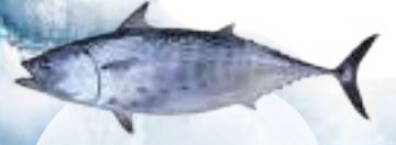
சின்னச் சூரை (Little Tunny/ Euthynnus affinis)