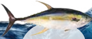
மஞ்சள் துடுப்பு சூரை (Yellowfin Tuna)