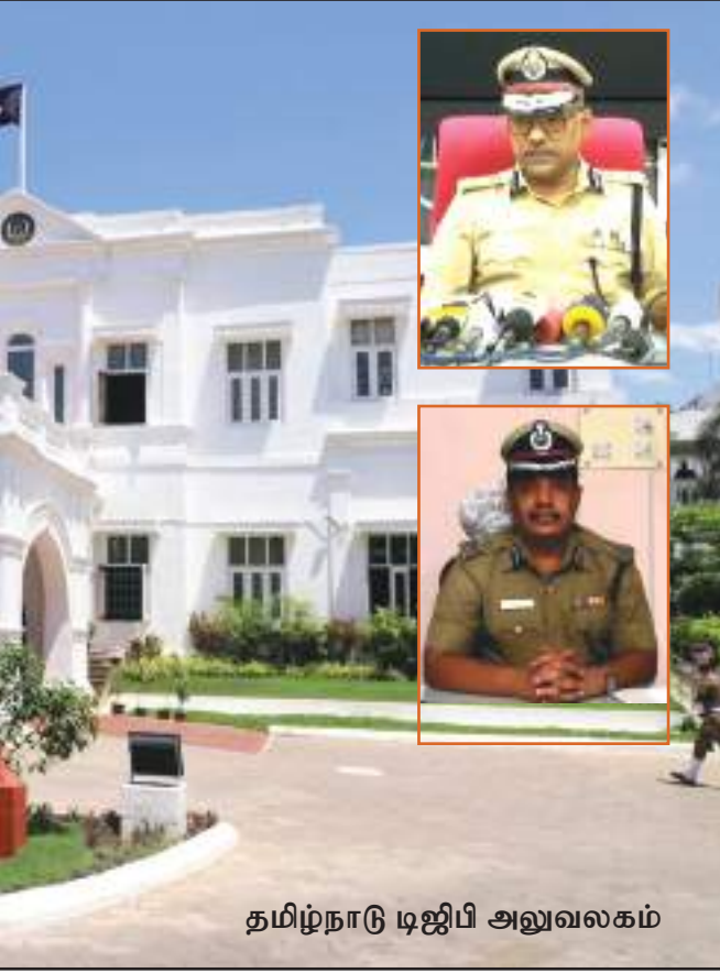
தமிழ்நாடு டிஜிபி அலுவலகம்

அதிகாரத்தை தவறாக பயன்படுத்துதல் மூலம் திமுக கைப்பற்றியதால் இதற்குத் “திருமங்கலம் ஃபார்முலா” என்ற பெயர் கிடைத்தது.